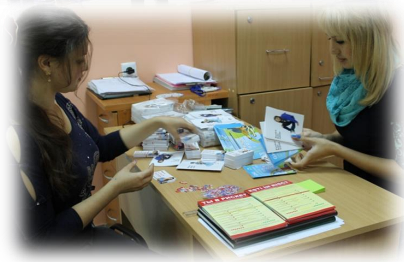
Prevenția HIV în rândul tinerilor: practici și recomandări